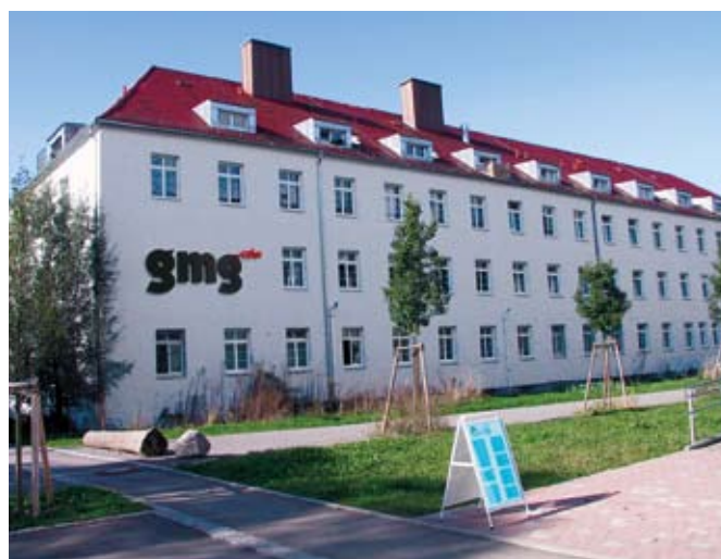
Centrála GMG v Tübingenu v Německu

Tyto snahy se už jasně odráží v našem současném portfoliu produktů – ale pořád ještě nejsme spokojeni s dosaženými výsledky. Proto neustále pracujeme na dalším vývoji našich produktů, abychom byli schopni dodávat našim zákazníkům v grafickém průmyslu ucelená řešení pro standardizaci a zjednodušení color management workflow – od konceptu až po hotový vytištěný produkt.